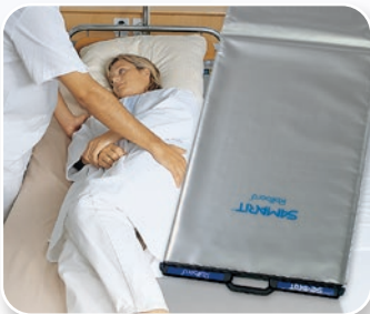
SAMARIT Rollbord Hightec