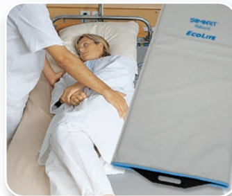
SAMARIT Rollbord ECOLite